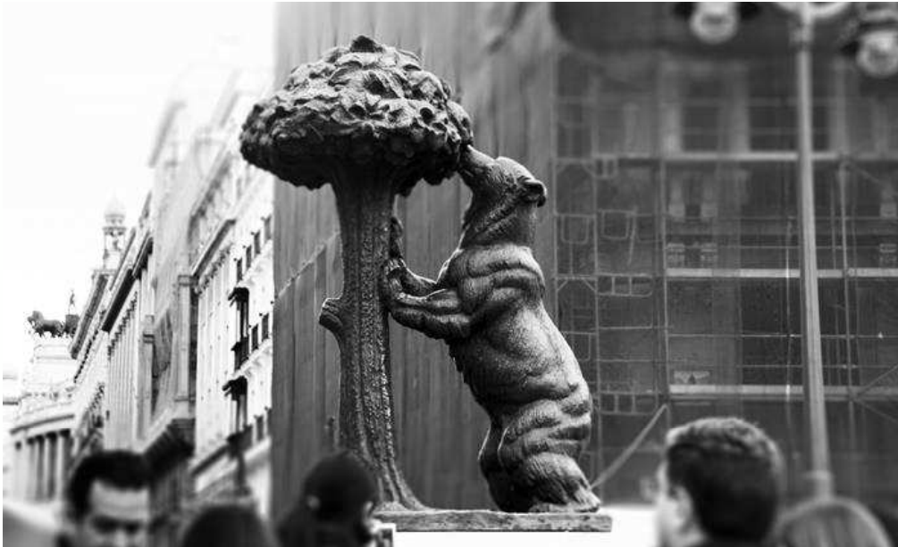
Madrid Puerta del Sol - Cagliari Torre dell'Elefante